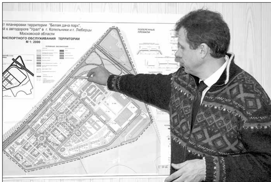
30 января состоялось очередное заседание Совета депутатов городского округа Котельники.