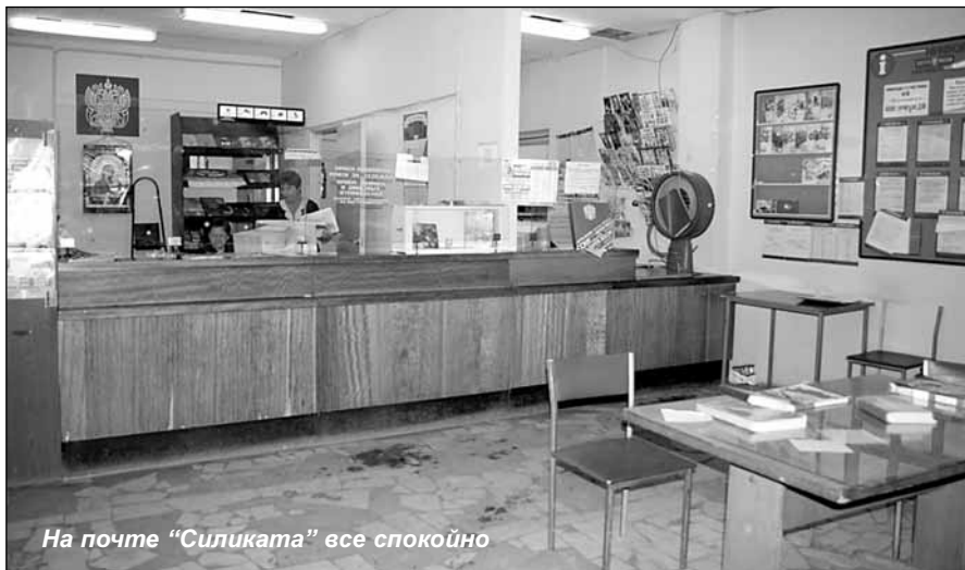
На почте "Силиката" все спокойно

В последнее время люди все реже и реже пользуются услугами почты и телеграфа. Звонить по межгороду горожане все чаще предпочитают с домашнего или сотового телефона, а обычным письмам предпочитают электронные - так проще и быстрее. Но в случае, если надо, скажем, отправить посылку или оплатить счета за коммунальные услуги, без визита в ближайшее почтовое отделение нашего города все же не обойтись.