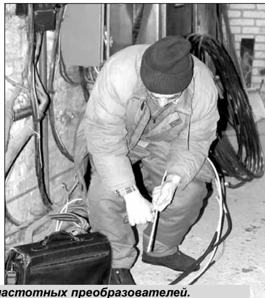
На ВЗУ "Белая Дача" идет промывка фильтров и монтаж частотных преобразователей.