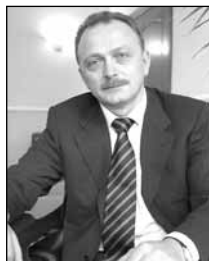
Семенов Виктор Александрович, депутат Государственной Думы РФ:

видя сегодняшние результаты развития и страны, и города. Конечно, есть вещи, которые огорчают, особенно старшее поколение. Но ведь выборы для того и существуют, чтобы высказать свое мнение, чтобы выбрать то будущее, в которое ты веришь. У меня в семье и в нашем доме на выборы всегда ходят все. Я считаю, у каждого должно быть право на выбор. Поэтому и в этот раз мы все собираемся на выборы 2 марта.