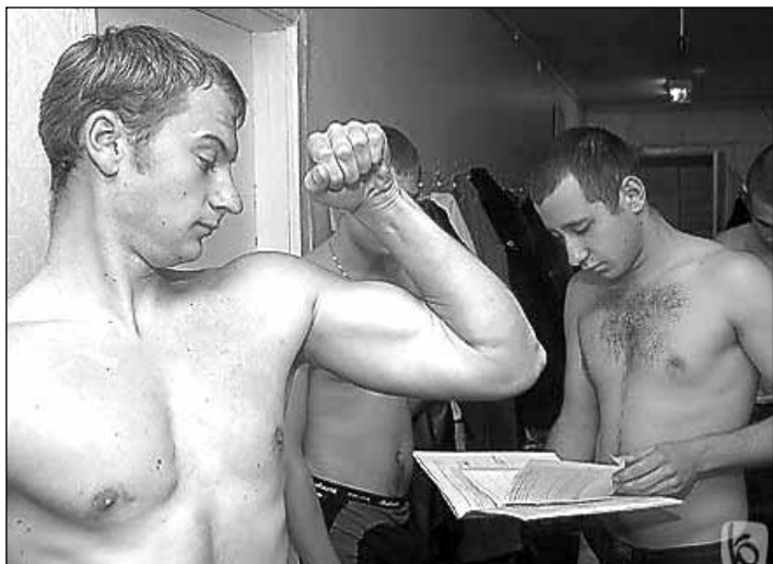
С 1 января по 31 марта в военных комиссариатах Московской области проводится первоначальная постановка на воинский учет граждан, которые в 2008 году достигнут возраста 17 лет.

Цель этого мероприятия - установление численности и категорий годности граждан к военной службе по состоянию здоровья, образовательному уровню, приобретенной специальности, профессиональной пригодности к подготовке по военно-учетным специальностям и обучению в военно-учебных заведениях.