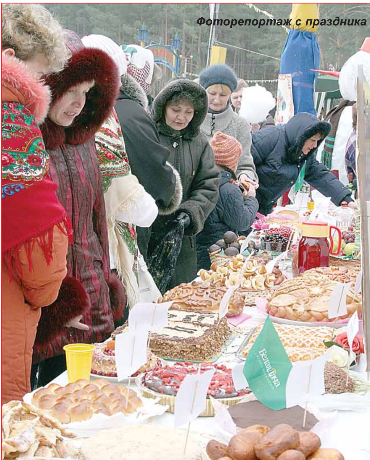
Фоторепортаж с праздника