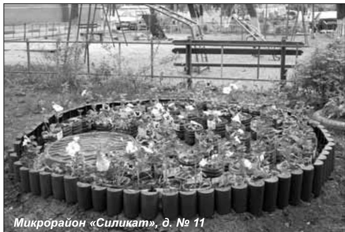
Микрорайон «Силикат», д. № 11