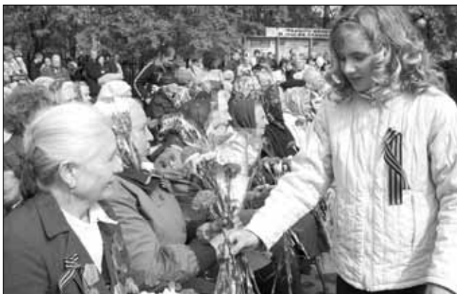
Не я участвовал в войне – Она участвует во мне.

Запомнилось зрителям как всегда яркое выступление ансамбля «Серпантин». А лучшим подарком ветеранам и молодежи стал приезд в наш город Эдуарда Лабковского, народного артиста России и первого исполнителя всенародно известной сегодня песни «День Победы».