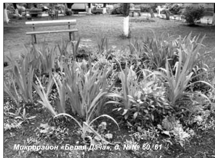
Микрорайон «Белая Дача», д. №№ 60, 61