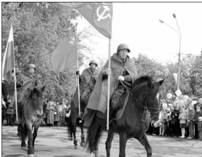
Главное – враги не победили, В этой битве победили мы! Дм. Кедрин

А утром 9 мая на площадь перед Дворцом культуры «Белая Дача» кони вынесли всадников с развернутыми знаменами.