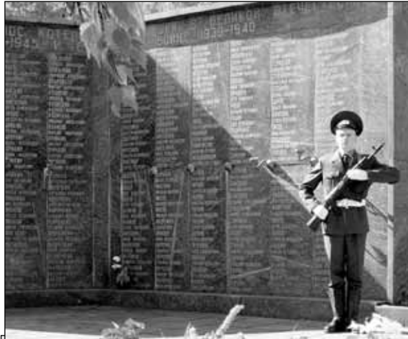
«Его зарыли в шар земной, как будто в мавзолей.»

В нашем городе волна праздничных мероприятий, посвященных 63-й годовщине Великой Победы, взяла свое начало 8 мая от церкви Казанской иконы Божьей Матери. Почетный караул у памятника воинам, павшим на полях сражений финской и Великой Отечественной войны, несли молодые солдаты воинской части № 55722.