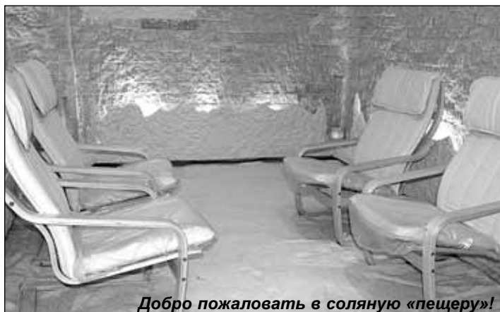
Добро пожаловать в соляную «пещеру»!