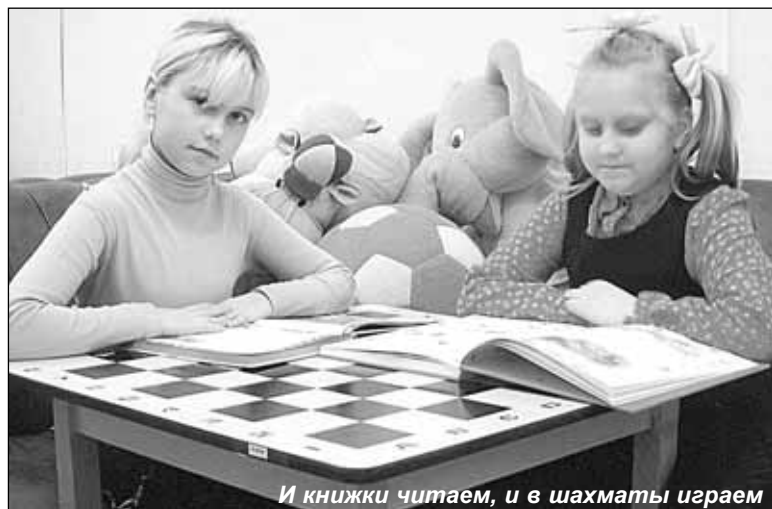
И книжки читаем, и в шахматы играем

По длинным коридорам, держась за руки, о чем-то чуть слышно разговаривая, проходят малыши. Кто-то спешит на осмотр в медицинский кабинет, а кто-