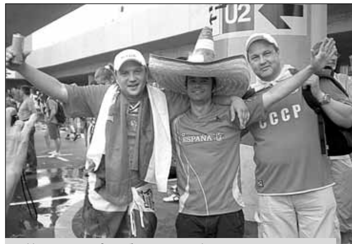
И проигрыш дружбе не помеха!

- Как бы не так! Для испанских болельщиков работали чуть ли не с десяток касс, а для нас - ни одной. Стали спрашивать, туда-сюда. Наконец нам ответили, что в день матча для российских болельщиков будет работать всего лишь одна (!) касса. Так вот в этот день мы простояли в очереди пять часов - под палящим солнцем, между прочим. Могли вообще без билетов остаться. Всё-таки как-то странно относится к своим соотечественникам российский футбольный союз. Не уважает.