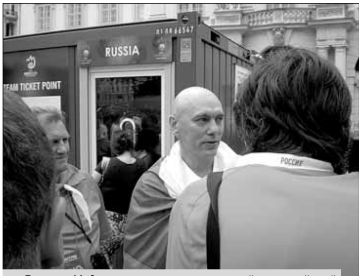
Вагиз Хидиятуллин - именной российский футболист, бронзовый призёр Олимпийских игр 1980 года, серебряный призёр чемпионата Европы 1988 года, вместе с остальными болельщиками стоял в очереди за билетами на футбол.

битом голе и впадаешь в дикое отчаяние при каждом поражении. Такой выброс адреналина - только держись! Я ездил на чемпионат Европы и четыре года назад.