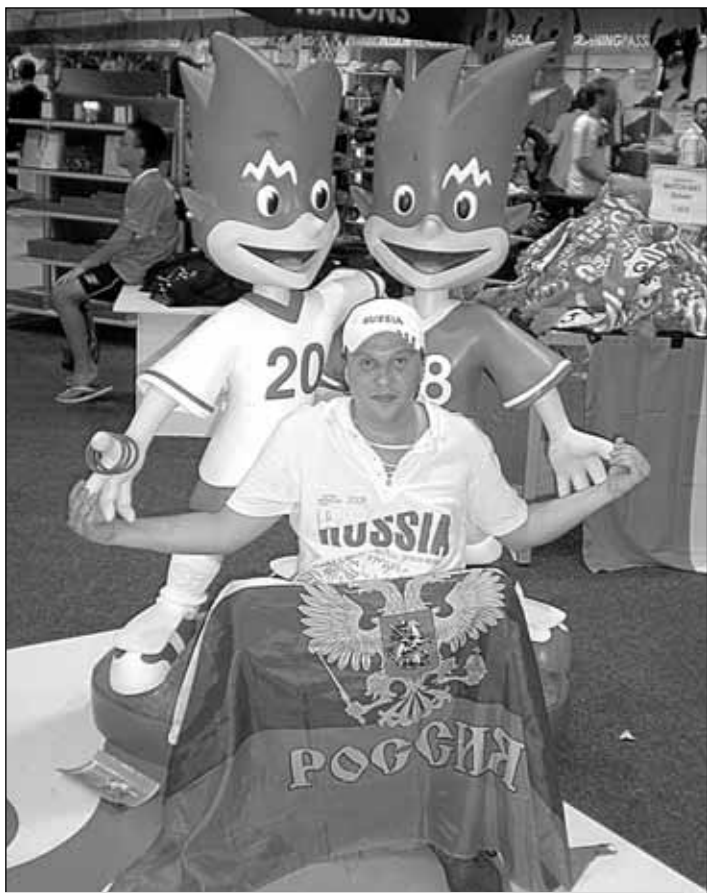
Трикс и Фликс - талисманы ЧЕ-2008. Фото на память.

- Самый первый и главный вопрос. Почему Вы тратите время, деньги, усилия на подобные поездки? Разве такая уж большая разница смотреть чемпионат Европы по телевизору или же на стадионе?