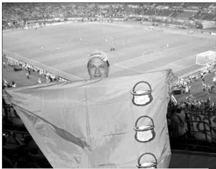
Вместе с российским флагом наши болельщики на матч с Испанией привезли и флаг Котельников.

ся» с нашим. Конечно, чепуха, не серьезно. А примета всё же плохая. Кстати, о суевериях. Этот пресловутый «Спорт-отель» какой-то несчастливый. Шведы там жили - нам проиграли. Мы там жили - испанцам продули.