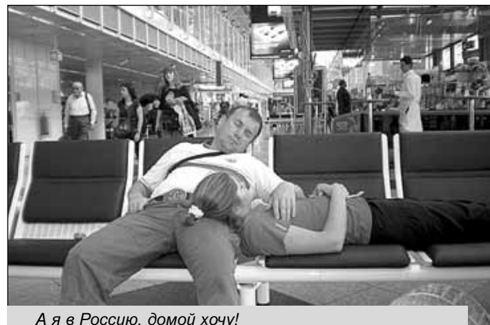
А я в Россию, домой хочу!