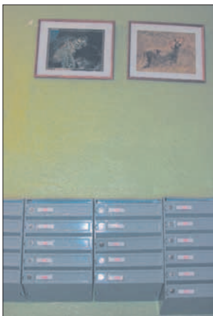
Самым лучшим подъездом назван подъезд дома № 27 микрорайона «Силикат».