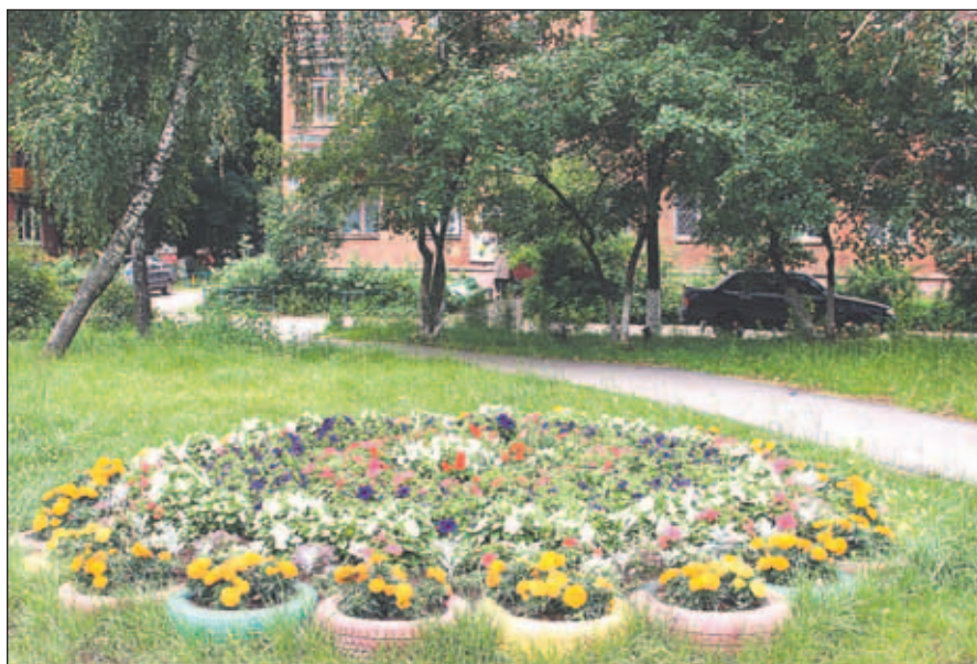
Лучшая клумба создана руками тосовцев дома № 21 микрорайона «Ковровый».

А еще тосовцы захотели узнать, будут ли в городе новые детские сады и школы. И получили утешающий ответ: в следующем году в микрорайоне «Силикат» должен появиться детский сад на 120 мест (проект сейчас находится на экспертизе), а на улице Новой планируется построить еще один детский сад на 160 мест. В микрорайоне же «Белая Дача» возведут не только детский сад на 240 мест, но и