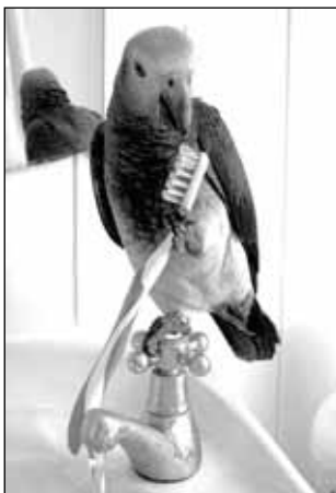
шума. Чтоб вы там все лопнули от зависти!"

☺ ☺ ☺ Разговаривают две блондинки: - Я решила не выходить замуж, пока мне не исполнится 25 лет! - А я решила вообще не достигать этого возраста, пока не выйду замуж! ☺ ☺ ☺ - Как у твоей жены продвигаются дела с вождением машины? - Отлично! Все дороги постепенно начинают вести туда, куда она хочет ехать! ☺ ☺ ☺ Мужчина просматривает автомобильные сайты и любит фотографии дорогих машин. - Машину себе выбираешь? - Ага - На рабочий стол или в мобильный? ☺ ☺ ☺ Водитель пришел в себя после аварии и спрашивает: - Где я? ☺ ☺ ☺ - В двадцать пятой. - Палате или камере? ☺ ☺ ☺ При моей манере вождения глупо беспокоиться об уровне холестерина в крови... ☺ ☺ ☺ Каждый мужчина с самого рождения стоит перед выбором, что лучше: всю жизнь питаться одной яичницей или каждое утро объяснять, где ты всю ночь шатался? ☺ ☺ ☺ - Я вчера жену на "Отелло" водил! - Культурная программа? - Нет, для профилактики... ☺ ☺ ☺ - Почему в Африке жену выбирают "побольше"? - Да она же тень отбрасывает! ☺ ☺ ☺ Письмо, которое было найдено в бутылке в океане: "Нахожусь на необитаемом острове. Ни магазинов, ни автомобилей, ни смога, ни