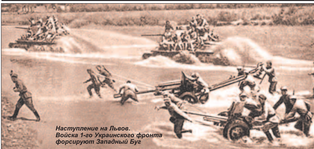
Наступление на Львов. Войска 1-го Украинского фронта форсируют Западный Буг