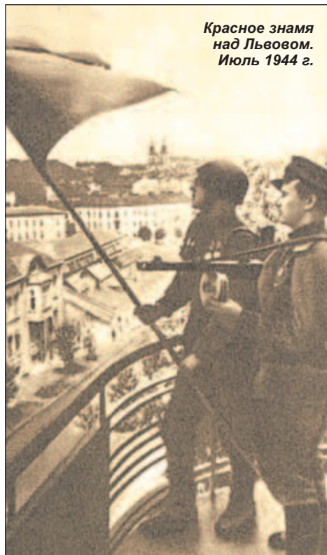
Красное знамя над Львовом. Июль 1944 г.

Не исчезает из памяти и Красный Дон, где они стали свидетелями того, как извлекали из шахты тела юных героев-подпольщиков, «молодогвардейцев», казненных фашистами.