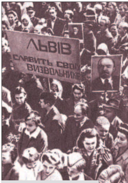
Митинг трудящихся Львова, посвященный освобождению города от фашистских захватчиков