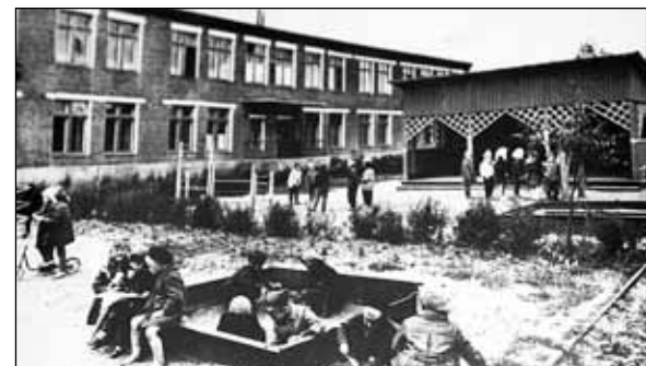
Сейчас в здании бывшего детского сада находится МУЖКП «Котельники»