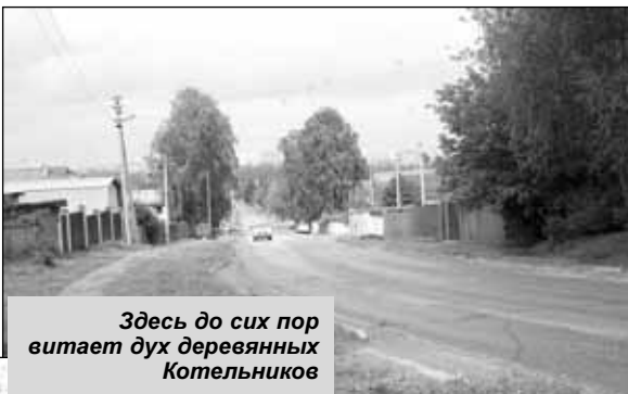
Здесь до сих пор витает дух деревянных Котельников