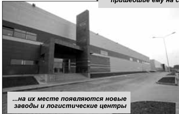
...на их месте появляются новые заводы и логистические центры