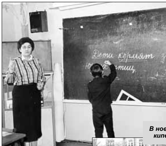
В новой школе кипела жизнь