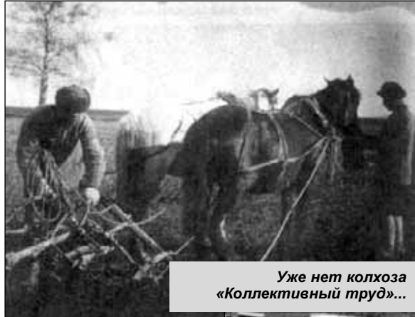
Уже нет колхоза «Коллективный труд»...

За годы войны церковь вытерпела многое. На втором этаже тогда устроили пошивочную мастерскую, на первый - ссыпали зерно. Дошло до того, что в стенах церкви даже баню организовали.