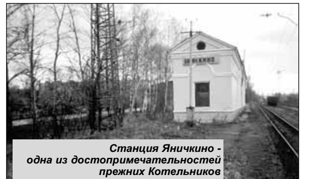
Станция Яничкино - одна из достопримечательностей прежних Котельников