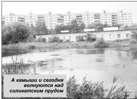
А камыши и сегодня волнуются над силикатским прудом

«В послевоенные годы люди не унывали, вместе работали, вместе и отды-