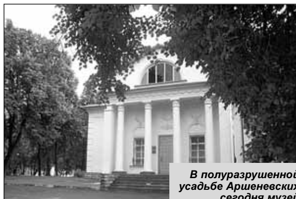
В полуразрушенной усадьбе Аршеневских сегодня музей а/ф «Белая Дача»

Господскую усадьбу окружали бараки и свинарники. Единственное сохранившееся с царских времен здание - бывшая конюшня, а рядом с ней конный двор,