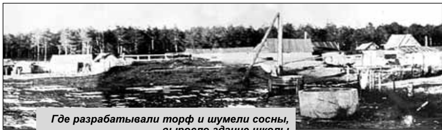
Где разрабатывали торф и шумели сосны, выросло здание школы

Зато в хозяйстве каждый год появлялось много нового жилья, на строительство которого шла большая часть денег (со