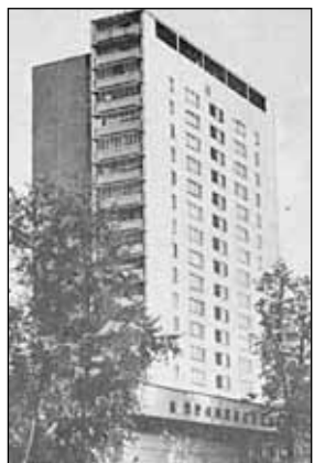
Эта высотка появилась на Силикате в 1979 году