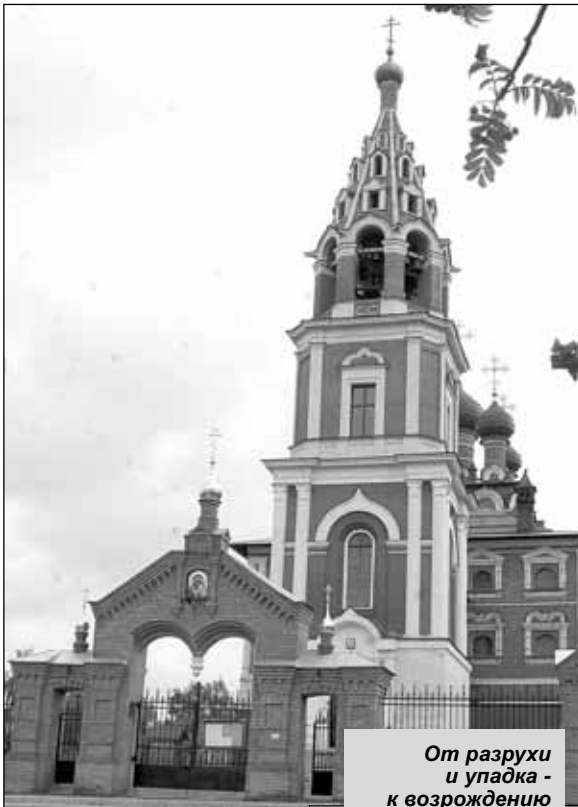
От разрухи и упадка - к возрождению

ция) - «Коллективный труд». В колхоз жители вступали со своей домашней живностью, курами, гусями, кто имел, приводил коров и лошадей. Все вместе ухаживали за скотом, обрабатывали поля, выращивали овощи. Наталья Ивановна напоминает, что на уроках труда их водили на завод смотреть, как изготавливается белый силикатный кирпич. Но работа на земле была деревенским мальчишкам и девочкам привычнее. Часто после занятий школьники вместе с учительницей ходили на колхозные поля помогать родителям. И мечтали, когда вырастут, будут работать в родном колхозе. Даже будущую специальность выбирали заранее, кому какая по душе. Правда, устроиться на работу в другом месте, хотя бы в соседнем колхозе, было практически невозможно. Ведь в то время почти ни