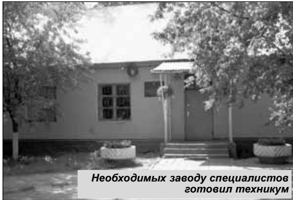
Необходимых заводу специалистов готовил техникум

ка, которой поначалу покрывались потолки. Позже, к большой радости новоселов, ее заменили на более качественную.