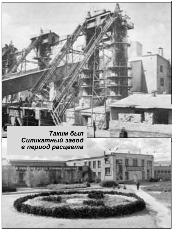
Таким был Силикатный завод в период расцвета

В 1951 году на Силикате отстроили двухэтажный клуб с уютной веран-