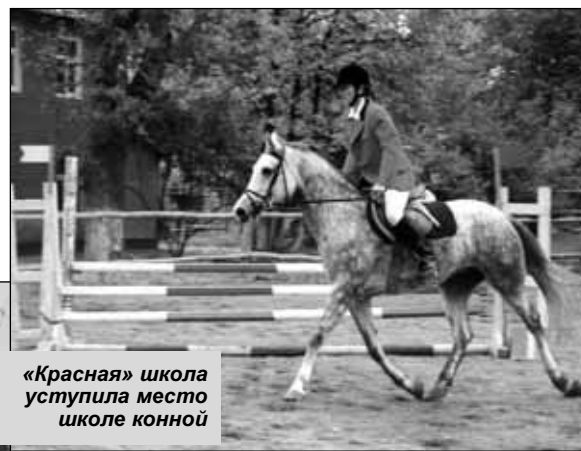
«Красная» школа уступила место школе конной

больше, чем ее подругам. Председатель отправил ее учиться на курсы трактористов, после окончания которых она потом пять лет пахала и боронила колхозные поля. Не прекращалась работа в этом хозяйстве и во время войны.