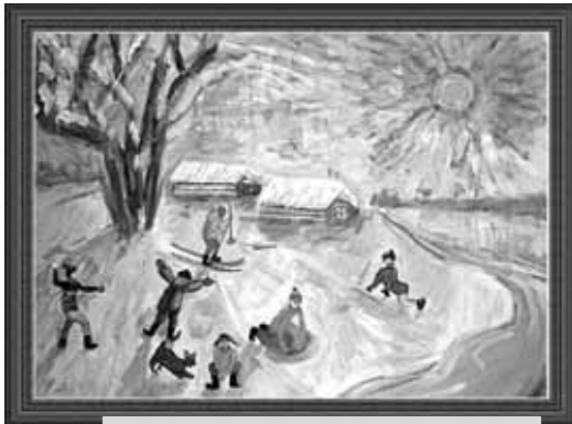
Возраст от 13 до 15 лет: третье место - Давтян Эдгар «Мороз и солнце - день»

В этом году тема была уже другой: «Поделись улыбкою своей». Количество участников значительно увеличилось – свои работы отправили более 700 ребят, котельниковцы заняли 80-е место по России. С каждым годом популярность и значимость участия в этом конкурсе растет.