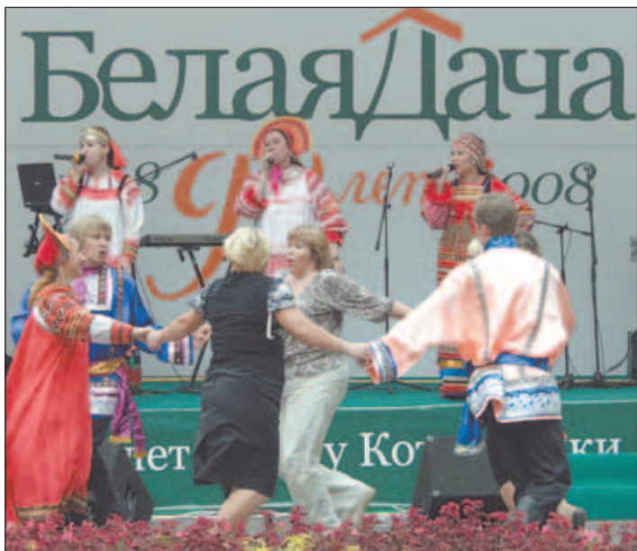
6 сентября был богат на праздники. 385-ый год рождения отмечали Котельники, а агрофирма «Белая Дача» праздновала свое 90-летие.

...Зелёная лужайка перед музеем агрофирмы «Белая Дача». За столиками - сотрудники предприятия. Через несколько минут здесь начнется награждение. В рамках 90-