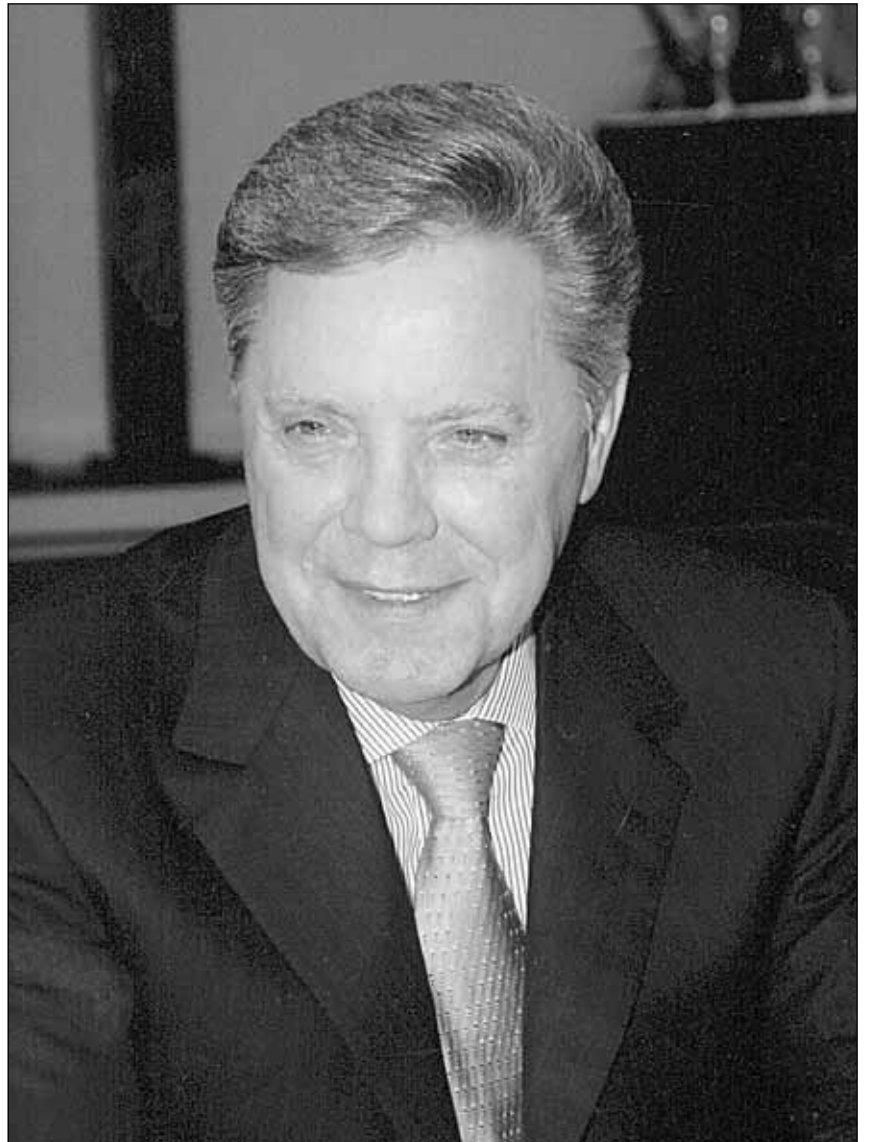
Московская область подтверждает свое лидерство по строительству жилья в стране. Данные государственной статистики говорят о том, что развитие экономики и, как следствие, социальной сферы Подмосковья имеет устойчивую положительную динамику. О том, каким образом достигаются такие результаты, корреспондент "РГ" беседует с губернатором Московской области Борисом Громовым.

Громов: Планы - часть жизни. А жизни без изменений не бывает. Наша задача, повторяю, поиск новых решений. В том числе и большая эффективность в работе.