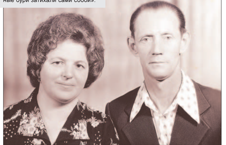
Материал подготовила Юлия Лаптева

Перед нами уже следующая фотография. «Это мы через 22 года после свадьбы, в 1980 году. Спокойное было время. Только через несколько лет в стране начались катаклизмы: перестройка, развал СССР, лихие девяностые... В ту пору почти всем пришлось туго, многие семьи распались. Мы же все неурядицы пережили вместе, поддерживая друг друга. Наверное, потому так долго прожили, что научились ценить и уважать спутника жизни. За 50 лет, конечно, всякое случалось, но в тяжелые моменты мы всегда вспоминали все лучшее, что было с нами за годы совместной жизни. И семейные бури затихали сами собой».