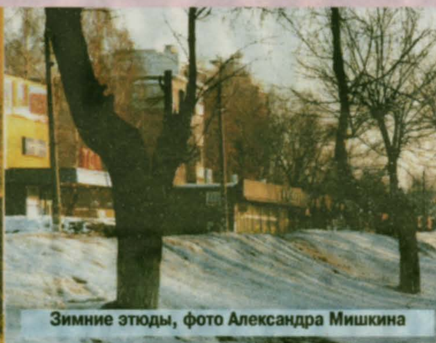
Зимние этюды