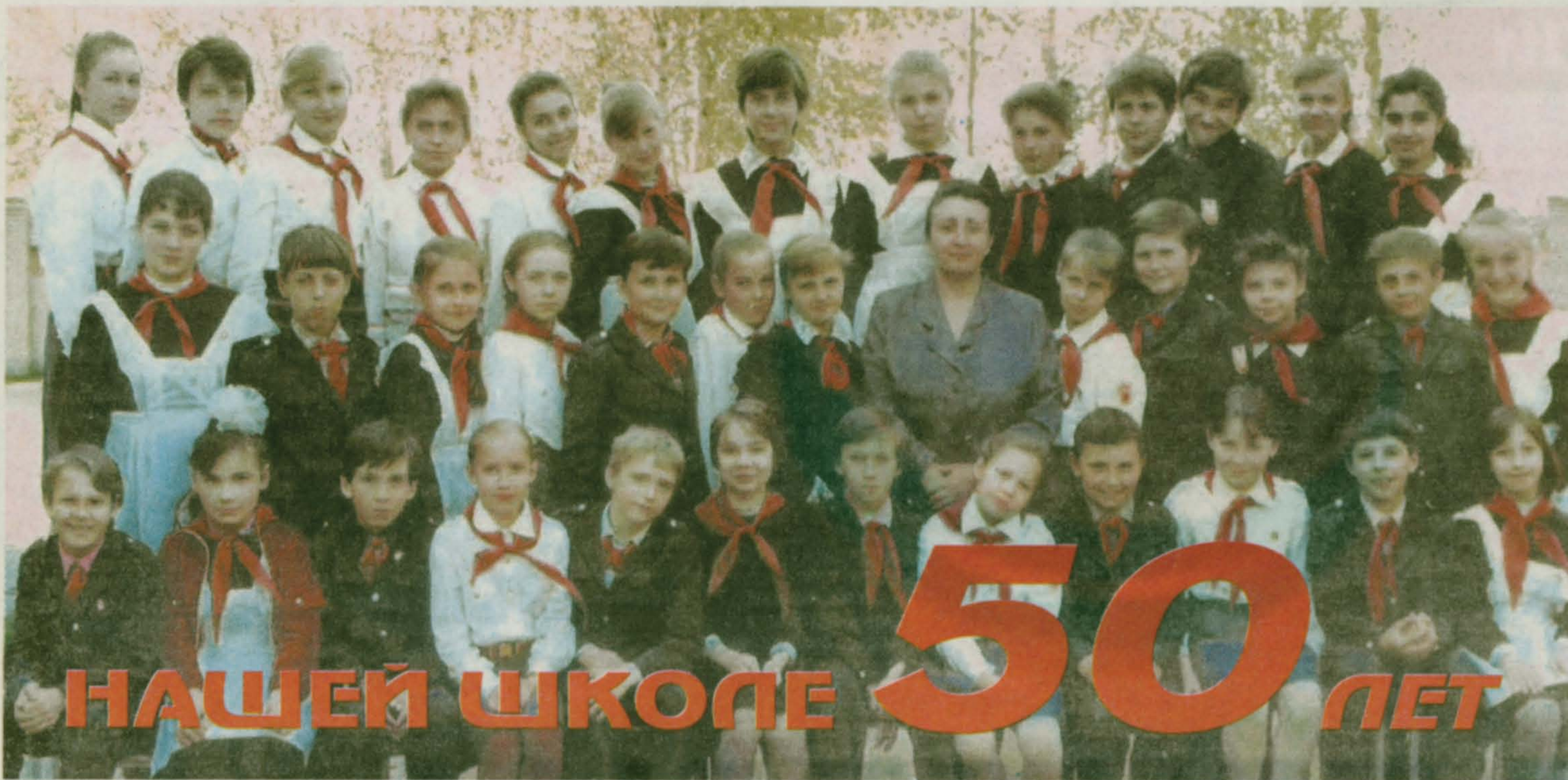
Это большая дата. Целых полвека! Вспоминается очень многое, но особенно то, как я 15 августа 1960 года переступила порог Красковской средней школы №55. Был теплый августовский день, и вот я пришла в школу, куда была назначена по направлению.