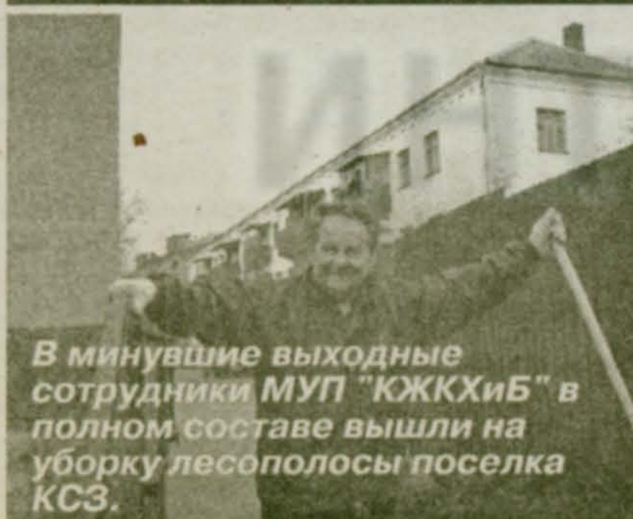
В минувшие выходные сотрудники МУП «КЖКХиБ» в полном составе вышли на уборку лесополосы поселка КСЗ.