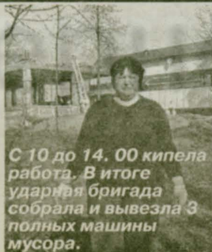
С 10 до 14.00 кипела работа. В итоге ударная бригада собралась и вывезла 3 полных машины мусора.