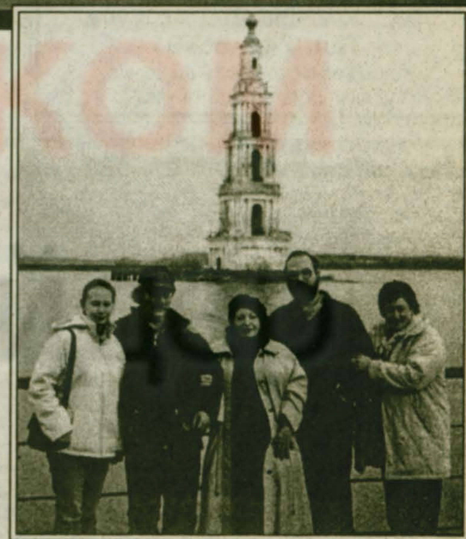
Томилинские экскурсанты на фоне затонувшей колокольни. Город Калязин на Волге.

Каждая поездка была неповторима, в каждой – своя изюминка. Будь благословенна наша Родина, ее старинные земли и неповторимый колорит русских городов. А впереди нас ждут старинный Углич, что на Волге, и другие дивные места.