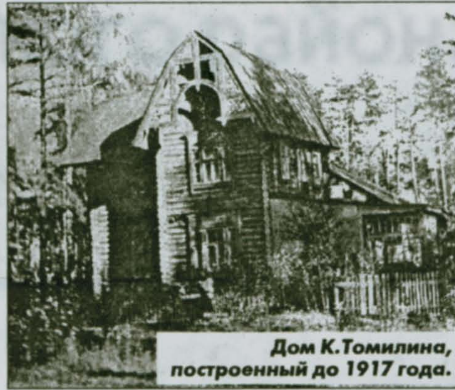
Дом К. Томилино, построенный до 1917 года.

Вот еще один любопытный факт тех времен: хлыстовские крестьяне отказались от земли и пошли работать на Люберецкие заводы.