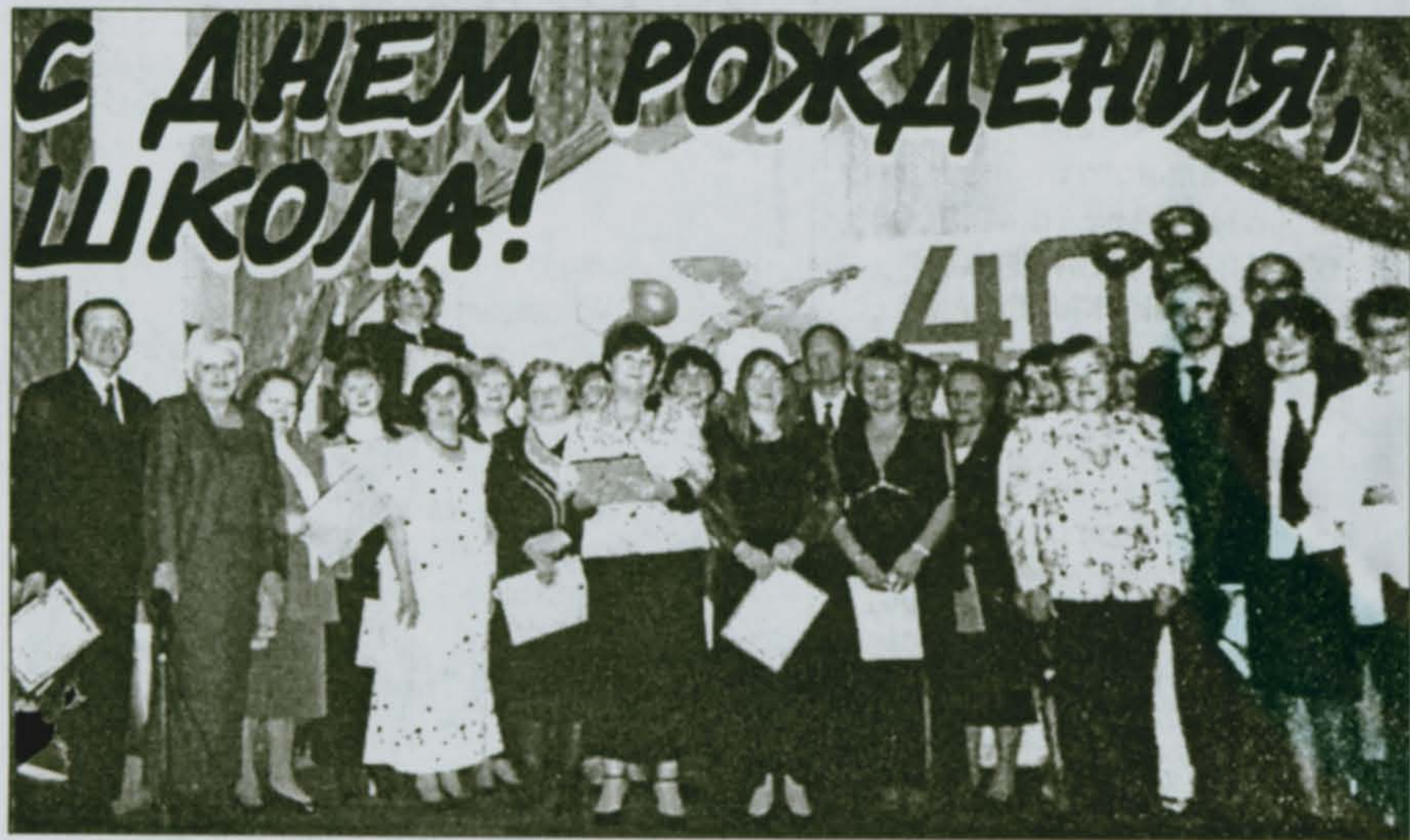
На юбилей принято приходить с подарками. Хорошо, когда сюрприз готовится не наспех, а заранее, от всей души и с учетом характера и образа жизни того, кому он предназначен.

Свой оптимистичный, по-юношески задорный характер «героине» нашего повествования удается сохранять, несмотря на вполне степенный возраст. А нынче, вы только посмотрите! Накануне своего 40-летия она еще больше помолодела: вряд ли найдется человек, который не отметил бы, как «к лицу» юбиляру подарок, что преподнесла ей администрация поселка Томилино. Причем готовила его не один день, а изрядную часть лета: летным, красивым, просторным холлом, обновленными классами встретила томилинская муниципальная школа № 19 свой 40-й день рождения и всех, кто пришел поздравить ее с этим знаменательным событием.