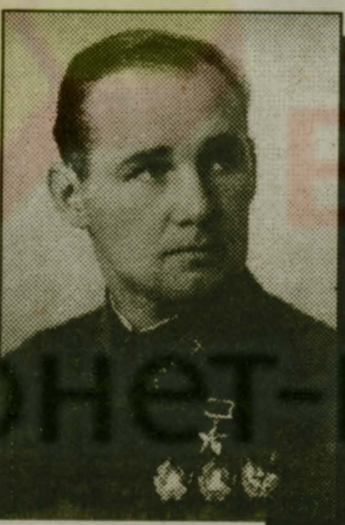
Приезжая к ней зимой или летом, я всегда приносил цветы, и все 25 лет, пока ее знал, она меня бранила: