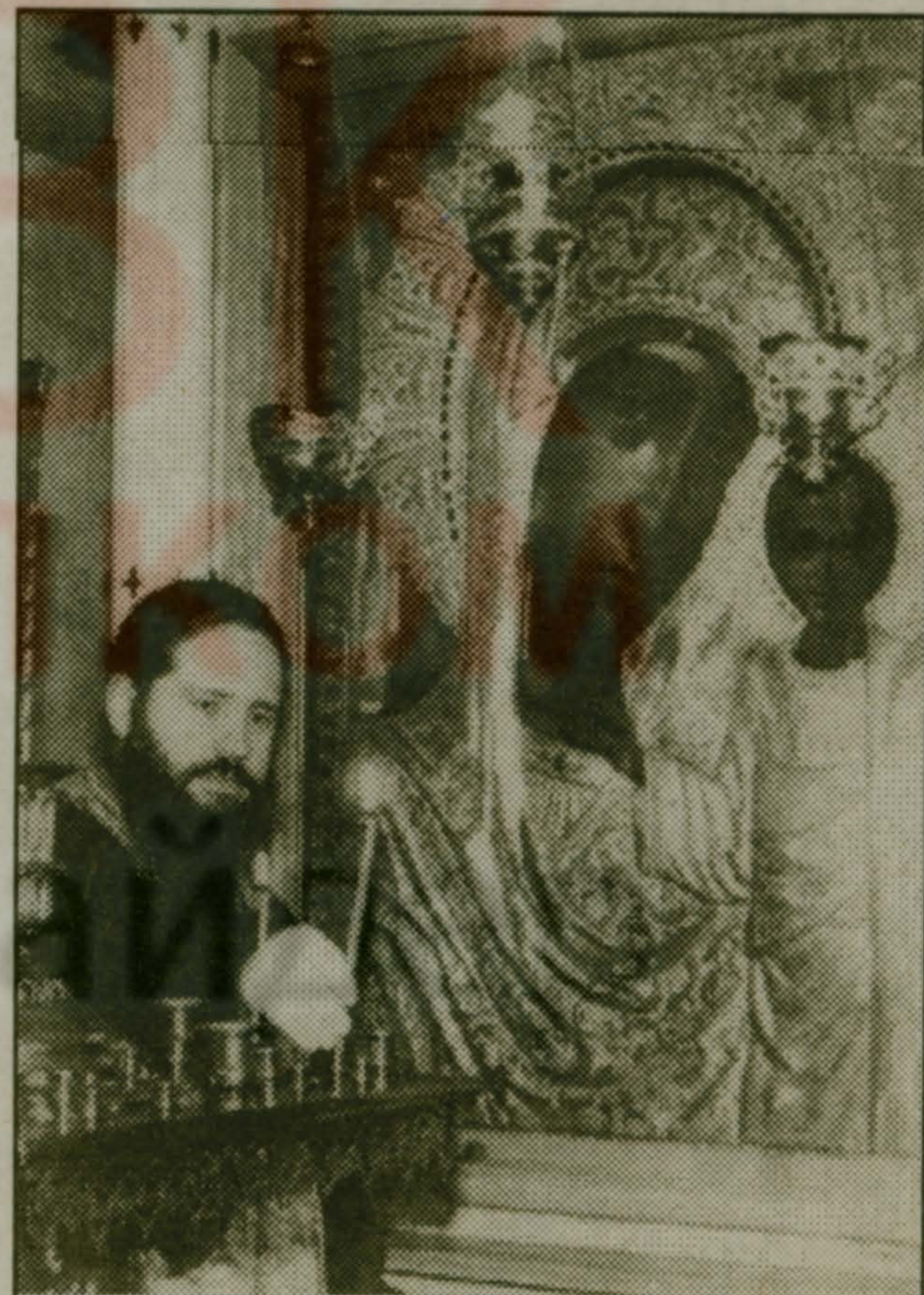
В храме иконы Казанской Божией Матери

Возможно, покидая неполюбившуюся ему Малаховку, Суриков оставил второпях на даче "Огородника", а может, и другие шедевры. Кто знает, вдруг счастье улыбнется и нынешним краеведам на какой-нибудь обветшавшей даче?