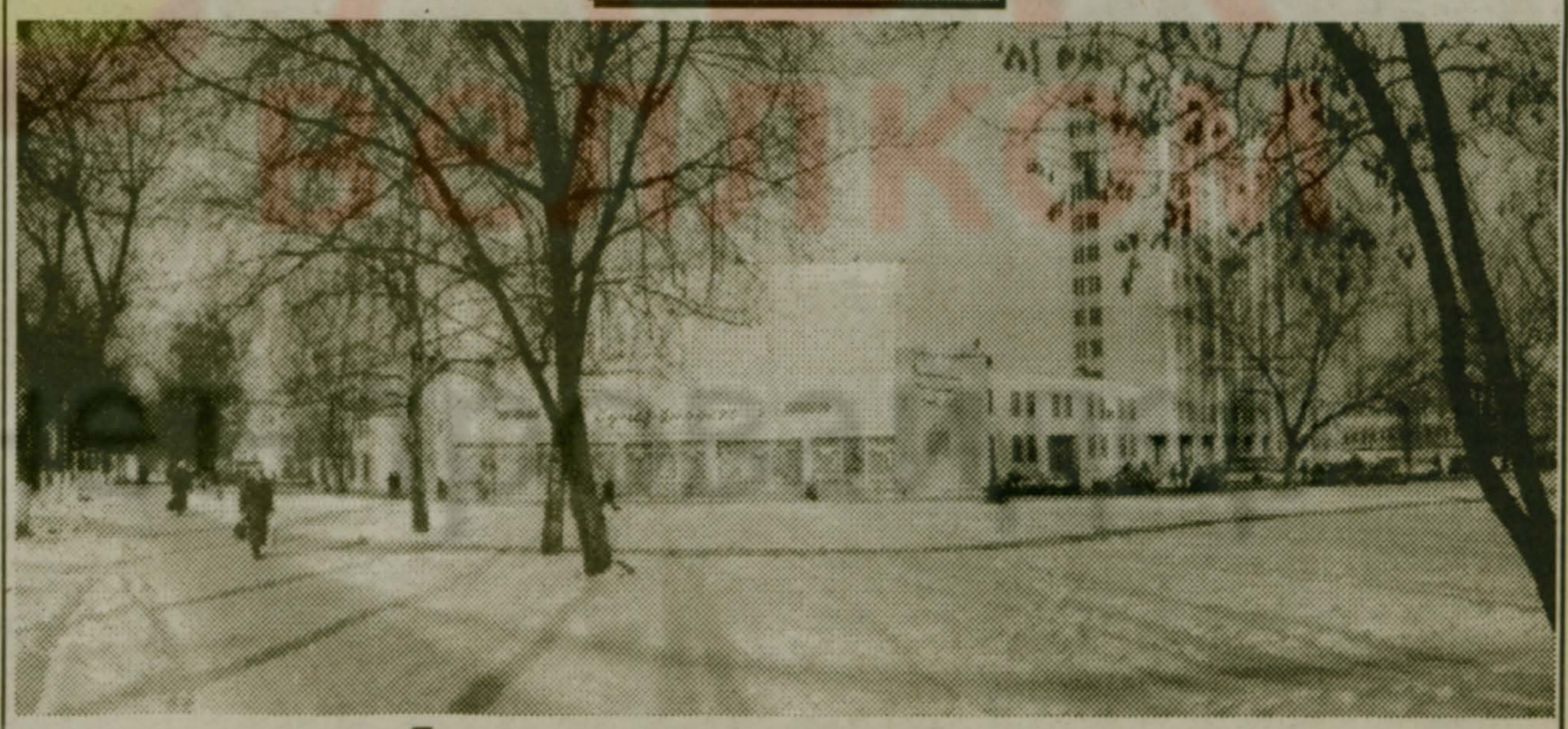
По хрустящему снежку