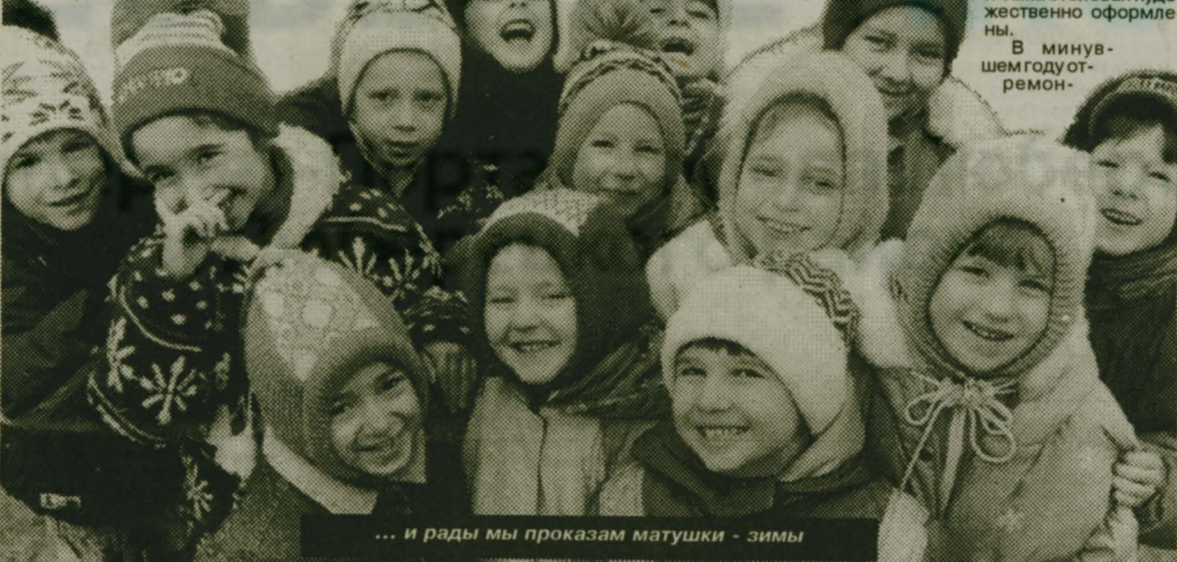
... и рады мы покажем матушки - зимы

подавания, новых курсов и программ ("Твоя вселенная", "Детская риторика", "Введение в историю", "Экология", "Художественный труд", "Прикладное творчество"), а коренное изменение психологии образования, реализацию глобальных программ через Центры "Здоровье", "Общение", "Учение", "Досуг", "Образ жизни", которые изменяют отношения между учителем и ребенком, заставляют их на самом деле находиться в режиме сотрудничества.