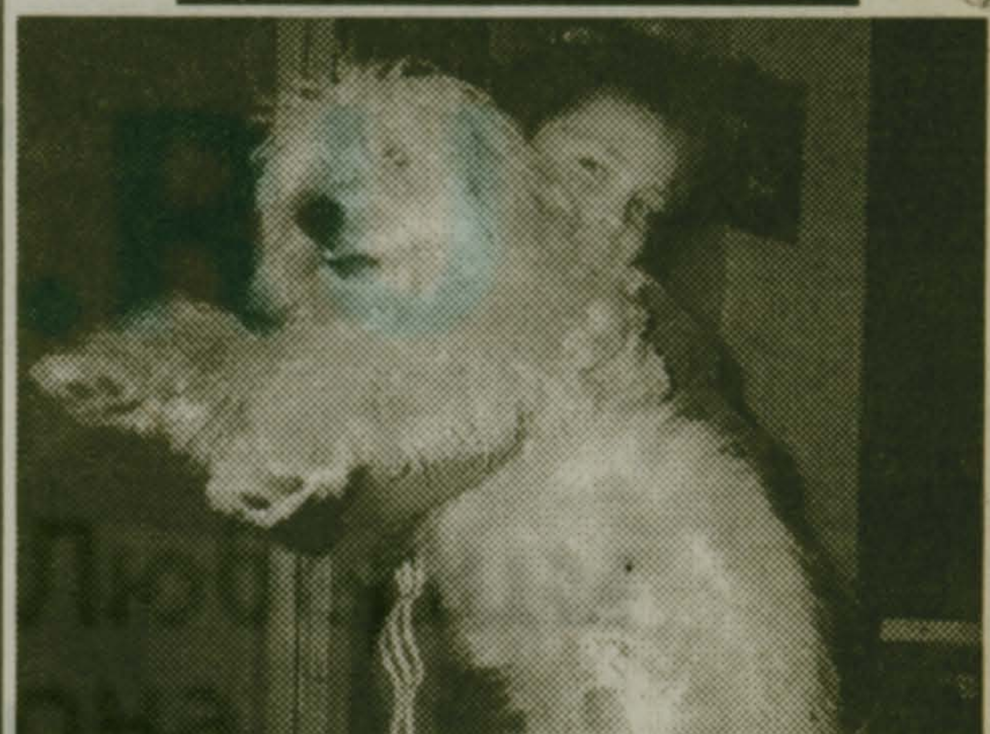
Хорошего пса должно быть много!