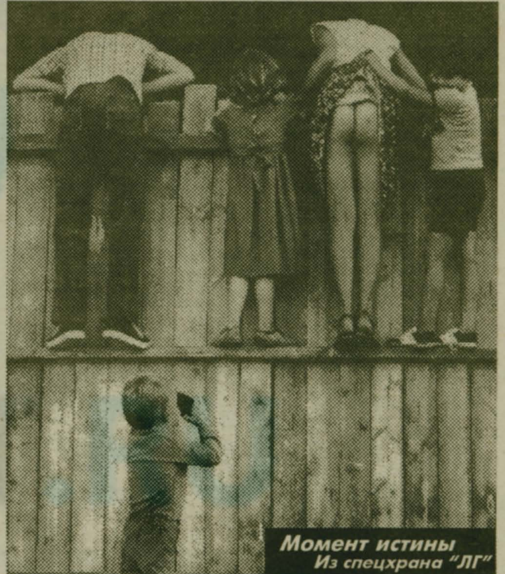
Момент истины Из спецхрана "ЛГ"

Монолог Ржевского записал Герман ГРЕБЕННИКОВ