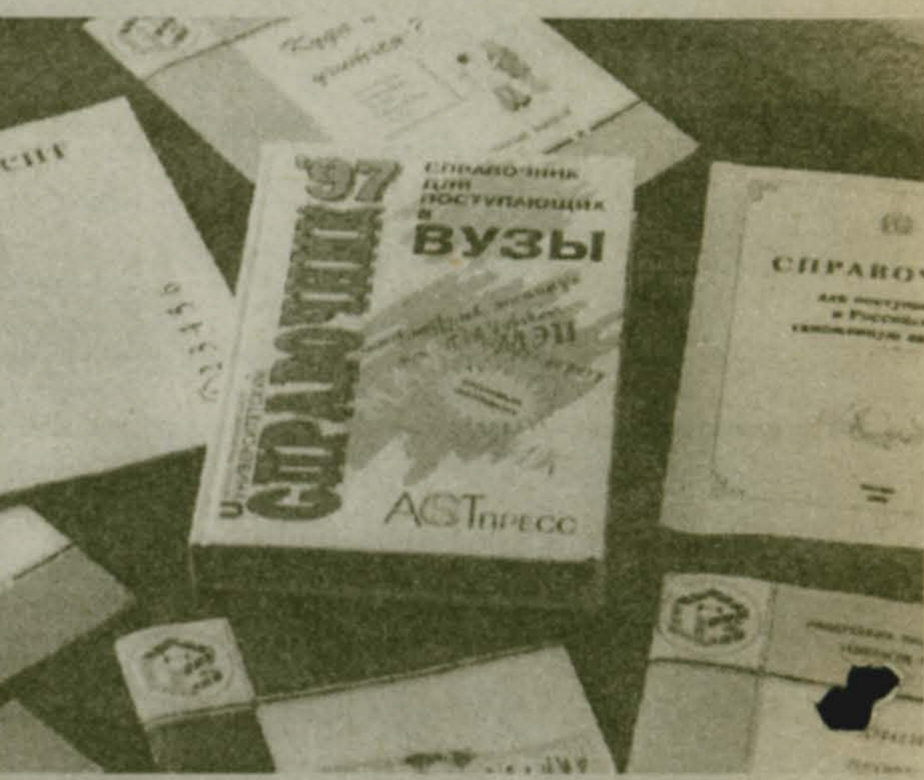
На снимках: ученицы 8 класса люберецкой школы № 25 Виктория Трычкина и Олеся Блинникова знакомятся с информацией центра занятости; справочная литература.