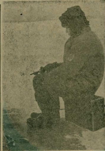
Подледный лов.