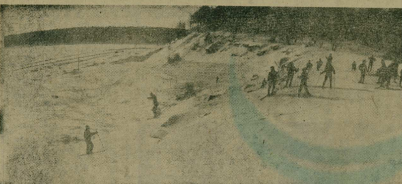
В зимний выходной.