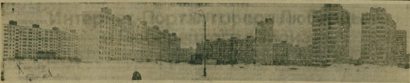
На этом снимке вы видите панораму улицы Побратнмов, расположенной в четвертом микрорайоне Люберец.