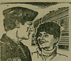
ЛЮБЛЮ ЖДУ ЛЕНА.

На экраны кинотеатров и домов культуры нашего района выходит новый художественный фильм режиссера С. Никоненко «Люблю. Жду. Лена». В основу этой картины легла повесть В. Деткова «Три слова». В самом деле, в записке, которую бережно хранит на груди, несет через тайгу Сергей Крутов, всего три слова. Но они обладают волшебной силой, они способны воскресить в душе человека радость и жажду жизни. Слова эти вынесены в название картины.