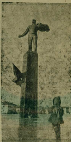
Е СТЬ на Смоленщине деревушка с незатейливым названием Клушино. Это родина первого космонавта Земли Юрия Алексеевича Гагарина.

Он родился в семье колхозников, где умели и любили трудиться. И это стало основой его характера — трудолюбие и упорство. В сорок пятом году из Клушино Гагарин переехал в Гжатск. Гжатский период жизни стал для Юрия Гагарина стартовой площадкой в небо. Здесь он с отличием закончил шесть классов, откуда уехал учиться в ремесленное училище в Люберцы. Затем — индустриально-педагогический техникум и аэроклуб в Саратове, авиационное училище в Оренбурге, служба военного летчика в ВВС. Эти годы были наполнены напряженным трудом, упорным стремлением к цели, уверенностью в правильно-