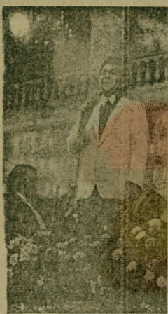
Народный артист РСФСР, лауреат премии Ленинского комсомола Иосиф Кобзон выступает на концерте в Колонном зале Дома союзов СССР.