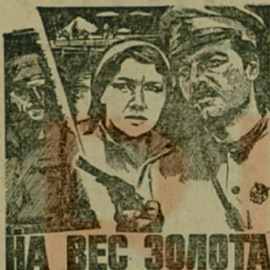
На экраны кинотеатров и домов культуры Люберецкого района выходит новый художественный фильм «На вес золота», снятый на киностудии имени А. Довженко.

Заслуженно пользуется в широкой зрительской аудитории, особенно молодежной, жанр историко-революционного приключенческого фильма. Несмотря на значительные успехи этого жанра, кинематограф продолжает его активно и успешно осваивать. Открываются все новые страницы истории революции гражданской войны, послевоенного восстановления страны... 1921 год. Только что закончилась гражданская война, в стране царил голод и разруха. В этих условиях народ Советской республики начал борьбу на трудовых фронтах, приступила к мирному строительству в кровапотворных боях отвоиненной новой жизни.