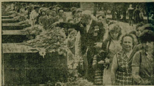
В память нашего народа навсегда останется чувство глубокой благодарности всем, кто не щадя своих сил и жизни, обеспечил разгром ненавистного врага.