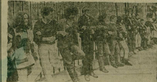
Эти молодые бельгийцы собрались у здания посольства США в Брюсселе, чтобы выразить протест против необъявленной войны, которую Вашингтон и вооруженные им наемники ведут в Никарагуа.