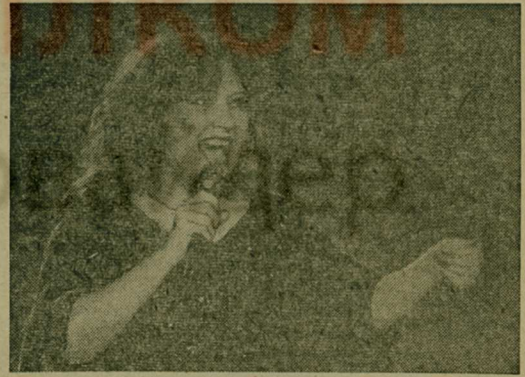
Москва. «Пришла и говорю» — так называется новая концертная программа, с которой заслуженная артистка РСФСР Алла Пугачева выступит в зале спорткомплекса «Олимпийский».

НА СНИМКЕ: поэт Алла Пугачева.