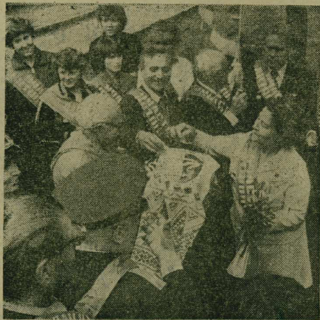
(Продолжение в следующем номере газеты).

На втором снимке: участники автопробега у танка, который первым вошел в Речицу при освобождении города.