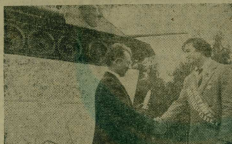
Окончание. Начало в № 120.