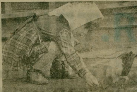
Так рождаются добрые чувства.

Котельниковский карьер привлекает в эти летние дни массу отдыхающих. Однако ковровый комбинат и другие предприятия, обязанные использовать пососвета благоустроить его, не проявляют заботы. Пляж не спланирован, дно не очищено от