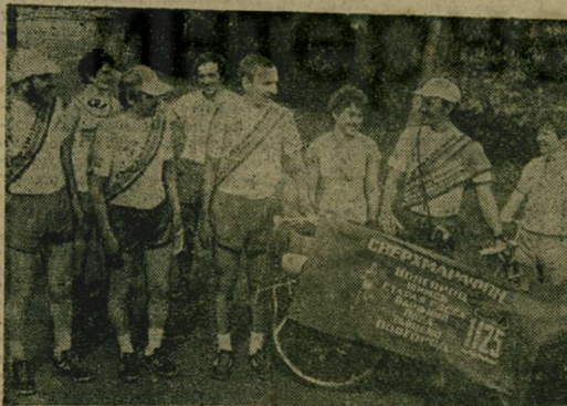
Новгородский «Кентавр» — один из активно работающих в стране клубов бега. Ныне он насчитывает более 200 членов.

М. ГЕРЧИКОВ, главный судья соревнований, мастер спорта СССР по шахматам.