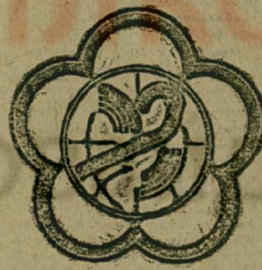
Утверждена эмблема XIII Всемирного фестиваля молодежи и студентов в Москве.

В соответствии с традициями международного фестиваля движения она представляет собой цветок с пятью лепестками, символизирующими континенты земного шара.