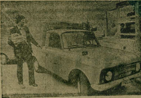
КАЗАХСКАЯ ССР. Новая модель почтовой автомашинки появилась на улицах Алма-Аты. Это опытный образец, сконструированный на Алма-Атинской автобазе Министерства связи республики на базе автомашинки «Москвич» ИЖ-2715. НА СНИМКЕ: водителю автобазы Т. Жуунубекову доверяют испытание новой машинки.