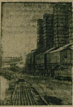
КЕМЕРОВСКАЯ ОБЛАСТЬ. Успешное выполнение обязательств — на год раньше установленного срока открыты движенье поездов на всем протяжении БАМа — записки не только от строителей магистралей, но и от их смежников, в числе которых — Кузнецкий металлургический комбинат имени В. И. Ленина. На снимке: состав с длиномерными термообработанными рельсами, подготовленный к отправке на БАМ.