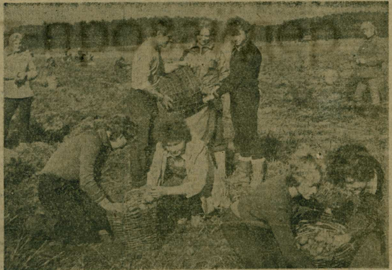
Сегодня и завтра в хозяйствах нашего района проводятся массовые субботник и воскресник по уборке картофеля, овощей и кормовых культур. Вместе с сельскими тружениками на поля выедут сотни горожан. Они помогут подобрать клубни за картофелекопалками, отсортировать и затарить мор-

ковь, столовую свеклу. Автомобилисты примут участие в доставке урожая с поля на овощные базы.