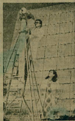
Педалеко от Ашхабада расположился настоящий солнечный городок, где испытываются узлы и блоки новых мощных солнечных электростанций. Здесь же создан первый гелиоэлектростанционный комплекс, позволяющий в летние дни получать ток от солнца, а в ненастье — от ветра.

Ученые Туркменистана создали множество солнечных устройств, которые успешно используются в народном хозяйстве. Это различные водонагреватели, опреснители, установки по выращиванию зеленых кормов, гелиодушевые.