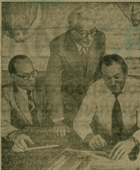
На соискание Государственной премии СССР 1984 года НОВЫЕ МЕТОДЫ СООРУЖЕНИЯ МОСТОВ

18 сентября в 14 часов в Люберецком Дворце культуры состоится очередная семинар руководителей групп политинформаторов, заведующих агитколлективами на производстве и по месту жительства, политинформаторов малочисленных партийных организаций лекторов общества «Знание». Отдел пропаганды и агитации Люберецкого ГК КПСС.