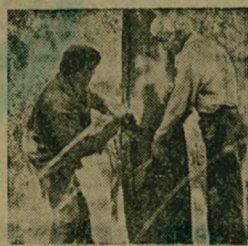
На десятки тысяч гектаров протянулись на юге Болгарии плантации пробкового дуба. Его ценная кора широко используется во многих отраслях промышленности.