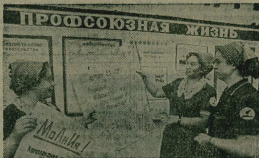
Ордена Ленина Ивановский комбинат имени В. И. Ленина с гордостью носит звание — «Коллектив коммунистического труда». Швейная промышленность и торговые организации получают от ивановцев ежегодно не менее 24 миллионов квадратных метров тканей. В успехах предприятия большая заслуга принадлежит профсоюзной организации. Профгруппы, а их на комбинате около 400, умело направляют движение за рас-

ширенную зону обслуживания. Массовое движение многостаночников позволило ивановским текстильщикам вот уже три пятилетки подряд получать значительный прирост выпускаемой продукции без увеличения численности работающих. Активно включились профгруппы в решение вопросов, связанных с внедрением бригадного подряда. Много внимания уделяется общению и распространению передового опыта на занятиях в школах коммунистического труда.