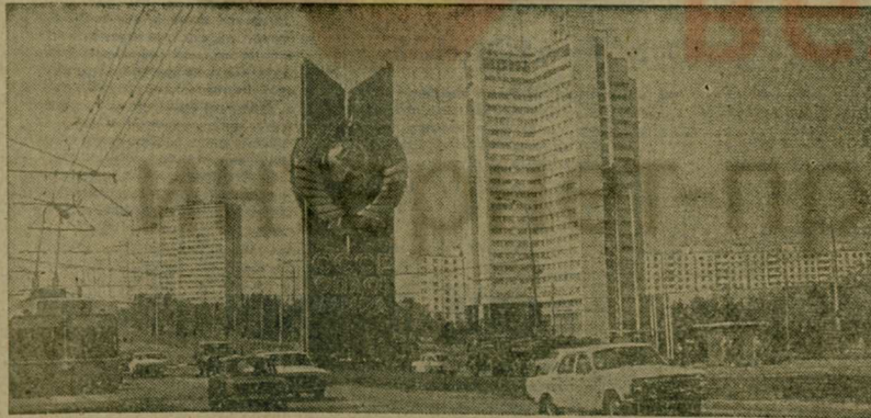
В ОБЪЕКТИВЕ — ПРЕОКТАЙСЬКАЯ МОСКВА