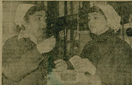
Высоких показателей в предоктябрьском социалистическом соревновании добивается коллектив электроцеха Люберецкого комбината строительных материалов и конструкций.