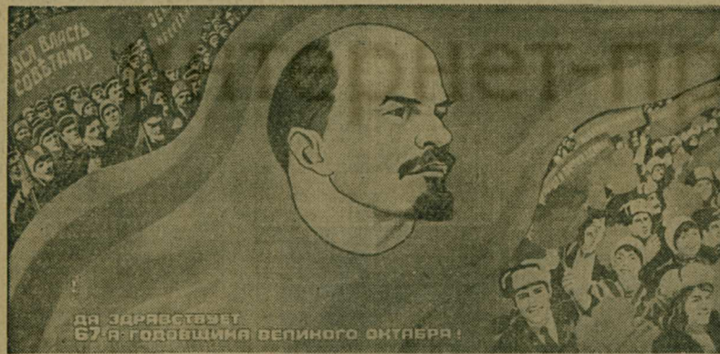
Да здравствует 67-я годовщина Великого Октября!