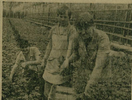
СВЕЖИЕ ОВОЩИ — КРУГЛЫЙ ГОД

В эти дни на прилавках магазинов, несмотря на позднюю осень, есть и помидоры, и ароматная зелень петрушки, сельдерея. Многие хозяева охотно берут к праздничному столу салат. Со 2 по 6 ноября только совхоз «Белая Дача» ежедневно отправлял в торговую сеть более 20 тонн помидоров и по 2—3 тонны витаминной зелени. Это хозяйство — самый крупный поставщик овощей защищенного грунта в нашем районе. Еще 11 июля цех растениеводства совхоза «Белая Дача» завершил план четырех лет пятилетки по продаже витаминной продукции. Успешно выполнен и социалистическое обязательство нынешнего года в объеме 21200 тонн, а сверх него уже продано 700 тонн овощей в широком ассортименте.